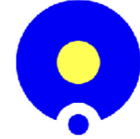
Uniwersytet im. Mikołaja Kopernika w Toruniu Nicolaus Copernicus University in Toruń